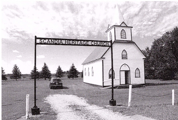
Scandia Heritage Church i Hendon. Många gravstenar på kyrkogården visar svenska namn. I en gästbok inne i kyrkan skrev jag mitt namn, den 23/8 2011