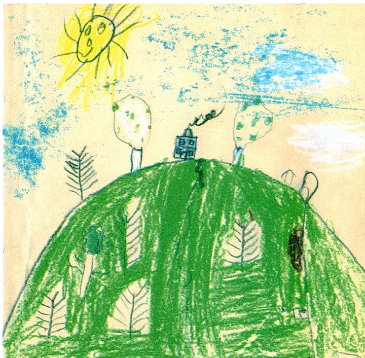
"Gud har skapat allt" Även Gesundaberget.