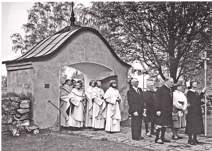
Bo Wallin installeras som kyrkoherde i Sollerö församling 1983.