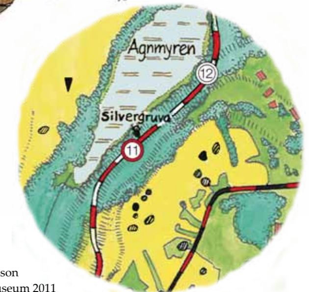
Illustration: Daniels Sven Olsson Text och layout: Dalarnas museum 2011