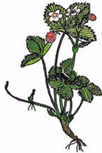
Backsmultron Fragaria viridis