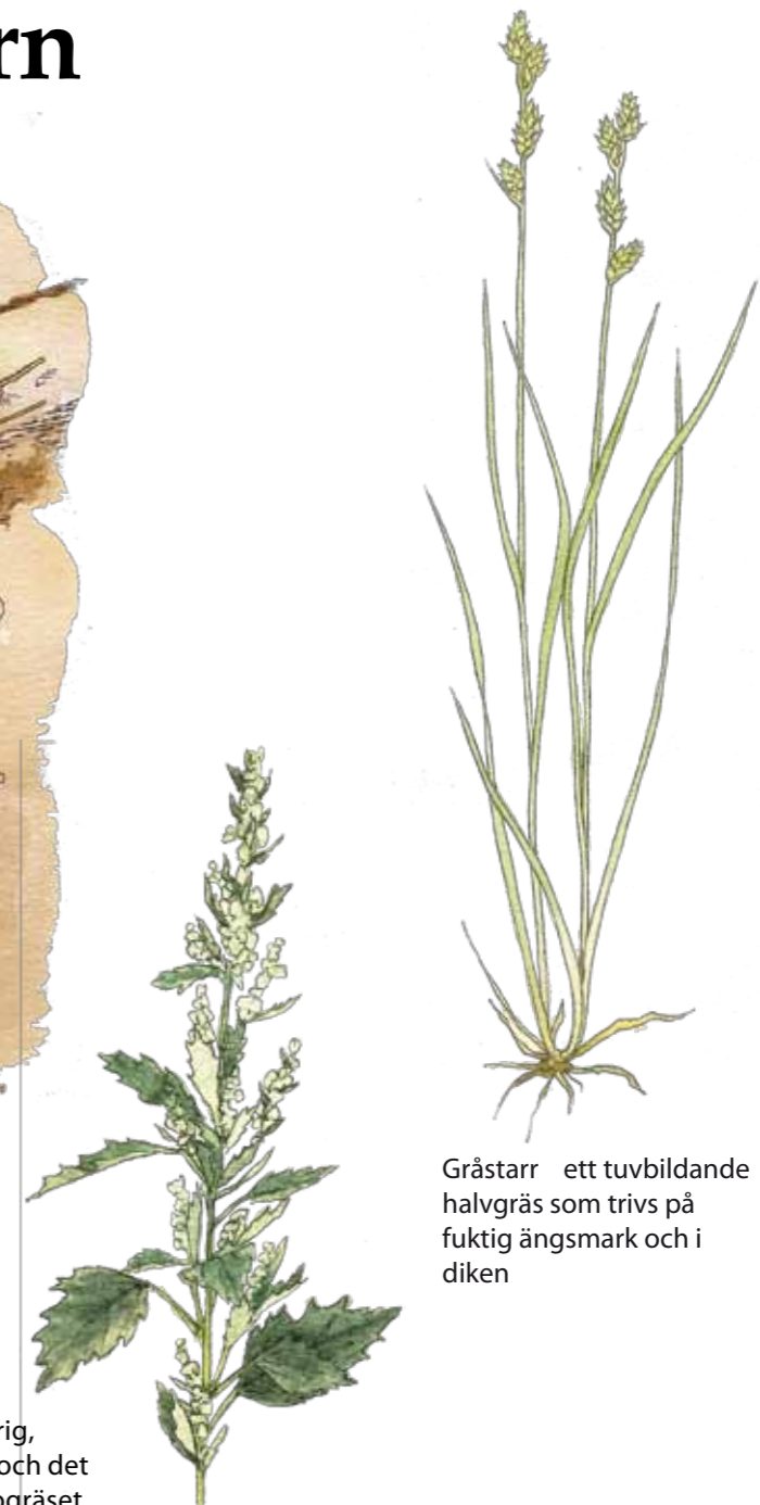
Grästarr ett tubbildande halvgräs som trivs på fuktig ängsmark och i diken

Illustrationer: Sylvia Måsan Illustration tidsaxel: Daniels Sven Olsson Text och layout: Dalarnas museum 2011